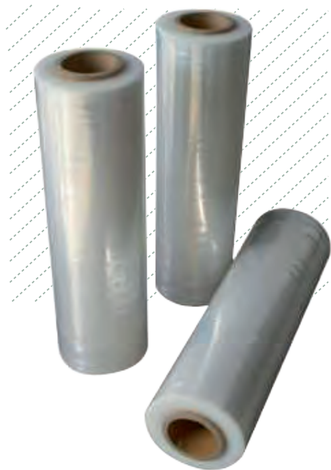
Film Paletizador Stretch Uso Manual